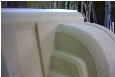
Borne kilométrique Sodilor