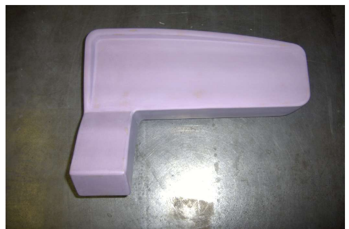
Modèle lavabo Ste Porcher

Maîtres modèles réalisés en médium par méthode STRATOCONCEPTION® après traitement