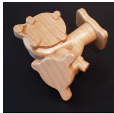
Maquette géométrique d'un turbo PSA Automobiles